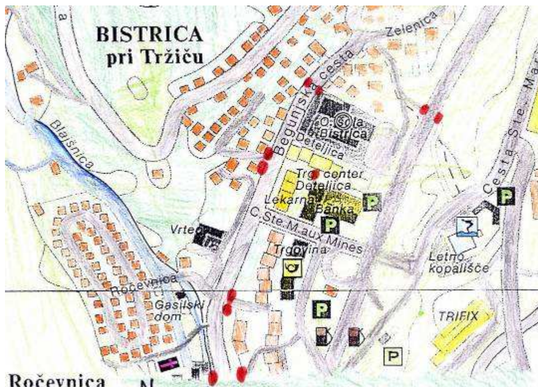
Slika 2: Neprijazni prehodi za invalide - načrti učencev