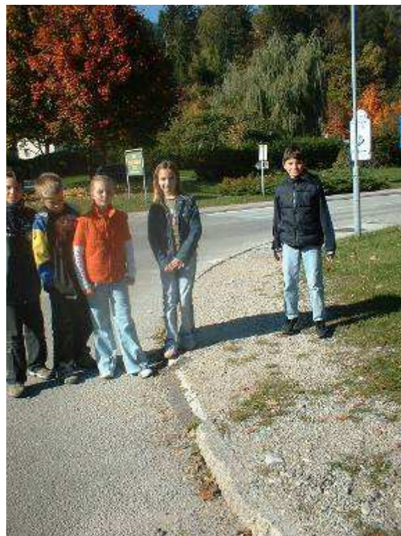
Slika 1: Delovanje gosenice in ogled previsokih robnikov